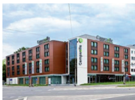
Hotel Campanile Wrocław Centrum Wrocław, ul. Ślężna 26